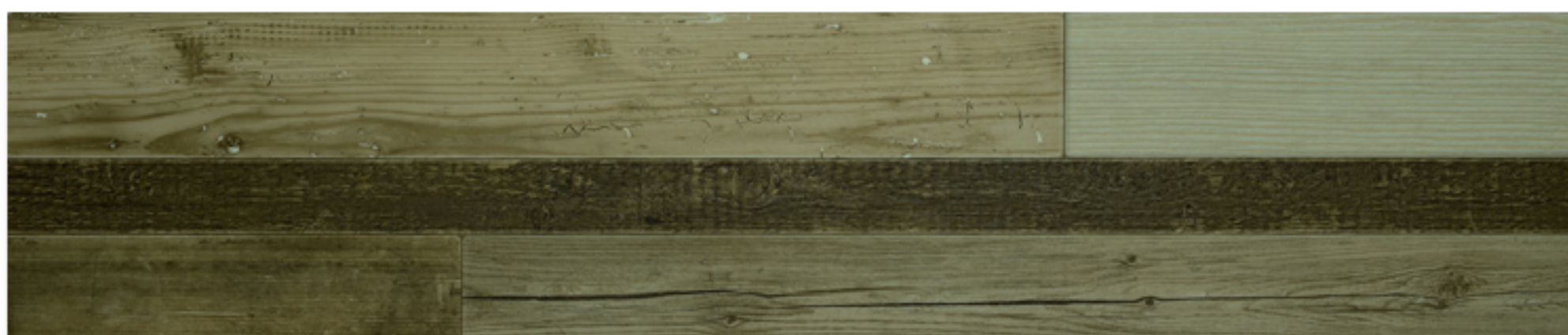
Transition in Time